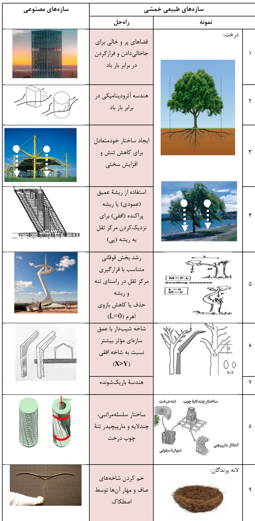
جدول ۱- نمونه‌هایی از راه‌حل‌های سازه‌های طبیعی در برابر خمش و الگو برداری از آن‌ها در سازه‌های مصنوعی.