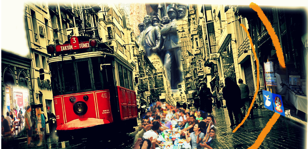
تصویر ۶- خوانشی از استقلال.

تجربه بی‌واسطه زندگی عمومی در خیابان استقلال، امکان خوانش معانی را فراهم می‌سازد. از جمله این معانی می‌توان به معانی منبعث از مکان‌های عمومی واقع در خیابان چون کافه‌ها، قهوه‌خانه‌ها و سایر پاتوق‌ها اشاره داشت. مکان‌هایی که در پیوند با زندگی روزمره خیابان و با بسط خود به شارع