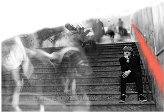
تصویر- پرسه‌زنی در شهر.