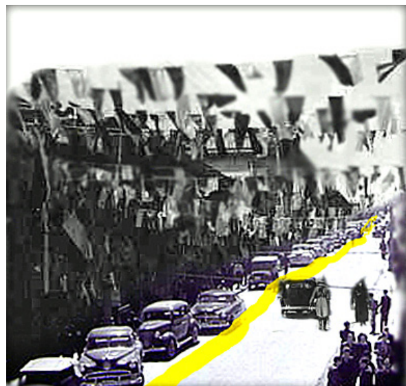
تصویر ۴- خیابان لاله‌زار در اوایل دوره پهلوی اول.

ساخت میدان توپخانه (۱۲۶۰ ه. ش) در تهران، اولین محصول تغییرات ناصری در شهر بود که توسط محمد ابراهیم معماری بنا شد. میدانی که از آن به عنوان نماد سبک تهران یاد می‌گردد (محمدزاده، ۱۳۸۲). دیگر تجلی کالبدی تجددگرایی ناصری با ساخت خیابانی بر طبق نقشه‌ای از نجم‌الملک به سال ۱۲۷۰ ه. ش (۱۸۹۱ م) است که عینیت می‌یابد. خیابانی در جبهه غربی باغ لاله‌زار تازه وارد شده به شهر از حد فاصل بخش شمال شرقی میدان مدرن و تازه تاسیس «توپخانه» به