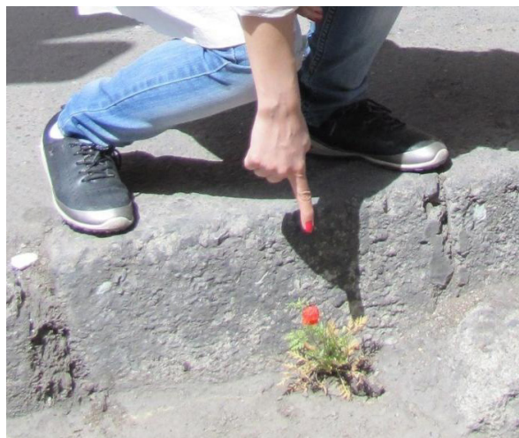
تصویر ۸- رویش گل در خیابان لاله‌زار، ۱۳۹۲.

مشاهدات همراه با مشارکت پرسه زن در خیابان؛ حکایت از عدم آگاهی و شناخت عموم نسبت به گذشته تاریخی - فرهنگی، هویتی و ارزش‌های نهفته در لاله‌زار دارد.