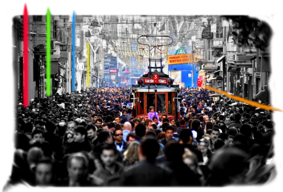
تصویر ۳- حضور خیابان در زندگی روزمره شهر استانبول.

با شروع دهه ۹۰ میلادی، روزنه‌ی امید برای بازگشت خیابان به شهر به مدد گسترش موج جدیدی از آگاهی‌رسانی‌های غیررسمی و خودانگیخته توسط طبقه روشنفکر جامعه ترک نسبت به گذشته خیابان به وجود می‌آید که با تشویق و مساعدت مدیریت شهری استانبول مواجه می‌گردد. مدیریت شهری با همکاری گروه‌های دانشگاهی و با دعوت از مشارکت مردم، خیابان را مورد نوسازی و احیاء قرار می‌دهد. طبقه همکف بسیاری از ساختمان‌ها بازسازی می‌شود و با تشویق‌های حکومت محلی، بستر حضور و فعالیت کاربری‌های متنوع و سازگاری با هویت خیابان چون رستوران‌ها، سینماها، کتاب‌فروشی‌ها، گالری‌ها و کافه‌ها مهیا می‌گردد. تراموای برقی خیابان استقلال به عنوان نماد هویتی خیابان، بار دیگر در سال‌های میانی دهه ۹۰ میلادی راه اندازی می‌شود و استقلال جاده‌سی بار دیگر به خیابانی پرشکوه برای حضور، مکث و پرسه‌زنی بدل می‌گردد که بر طبق آمار شهرداری استانبول (۲۰۱۰)، سالانه پذیرای هفت میلیون توریست خارجی است (Aduan, 2011, 4).