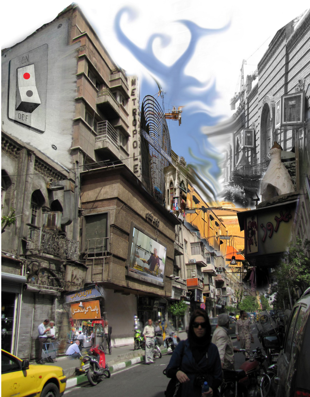
تصویر ۹- خوانشی از لاله‌زار.

این عدم توجه به یک معنا، هویت و یا یک مکان از جانب حاضران، فارغ از نام و کارکرد آن، در واقع امر، بازگوکننده عدم اجازه درک و خوانش خیابان از جانب عوامل و نیروهای شکل‌دهنده امروز آن است. چراکه آنچه امروزه به لاله‌زار شکل می‌دهد نه نظم، بلکه اغتشاش است. لاله‌زار امروز معبری جهت گذر صرف، فارغ از حس، تأمل و درک است. حال