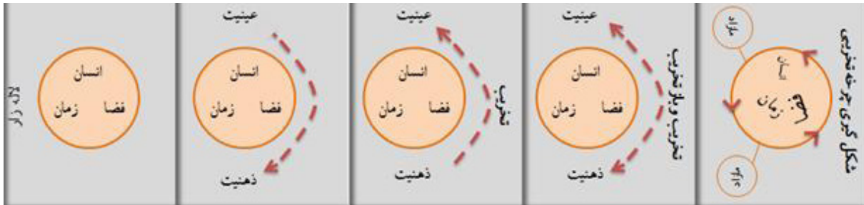
تصویر ۱۰- چرخه تخریبی حاصل از افتراق عینت‌ها و ذهنیت‌ها در خیابان لاله‌زار و تخریب مفاهیم انسان، زمان و مکان در آن.