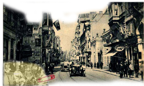
تصویر ۲- حفظ کلیت خیابان استقلال در قبل و بعد از اصلاحات برآمده از مدرنیزاسیون در ابتدای قرن ۲۰ میلادی.