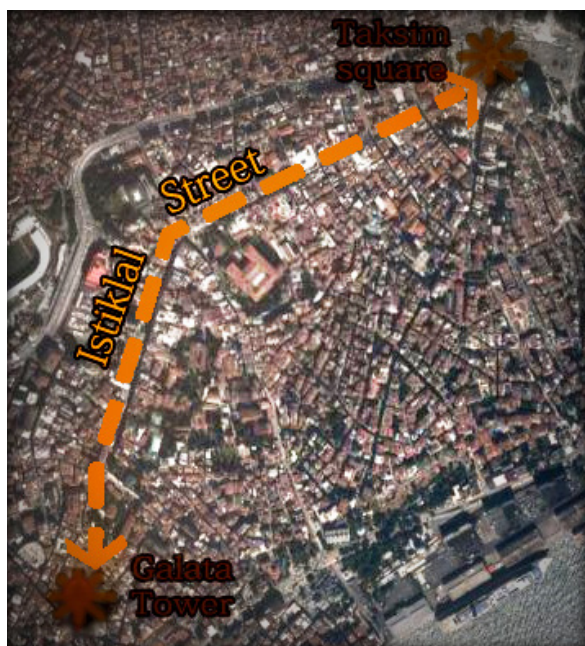
تصویر ۵- موقعیت خیابان استقلال در حد فاصل میدان تقسیم تا برج گالاتاتاور.

خیابانی که به یمن ویژگی‌هایی چون دسترسی مناسب، انعطاف‌پذیری، ایمنی، سازگاری و بهره‌مندی از تسهیلات ویژه جهت پیاده‌روی از یکسو و حضور فعالیت‌های محلی و متنوعی چون قهوه‌خانه‌ها، بازارهای روزانه، کافه‌های قدیمی در کنار فعالیت‌های جهانی و نوینی از قبیل نمایندگی برندهای معتبر، بانک‌های جهانی، کافه کتاب‌هایی به سبک فرانسوی و سینماهایی با فیلم‌های روی پرده به روز سینمای جهان از دیگر سوی، زمینه‌های لازم برای حضور، مکث، پرسه‌زنی و بودن در میان دیگران را فراهم نموده است. مشاهدات پرسه‌زن در خیابان، حکایت از مراجعه گروه‌های مختلفی از خرده فرهنگ‌های سنی و جنسی و از ملل گوناگون به عرصه خیابان دارد. آمار رسمی تعداد این مراجعان را یک میلیون نفر در روز