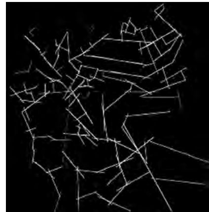
تصویر ۸- تحلیل هم پیوندی برای گزینه دوم.