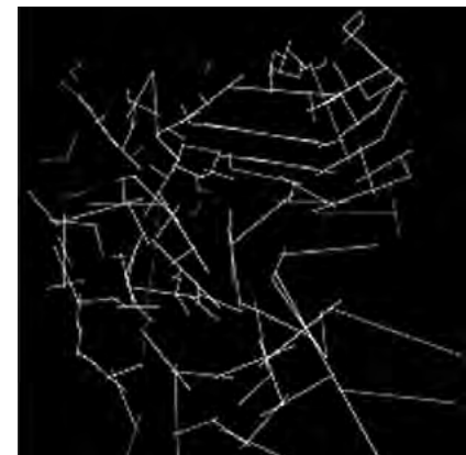
تصویر ۹- تحلیل هم پیوندی برای گزینه سوم.