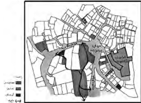
تصویر ۶- گزینه سوم.