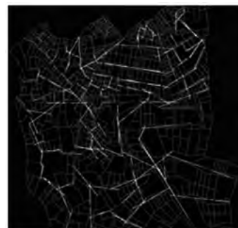
تصویر ۲- تحلیل هم پیوندی محدوده در مقیاس جهانی.