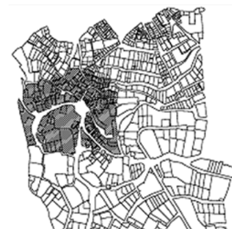
تصویر ۳- محدوده طراحی در مقیاس محلی.