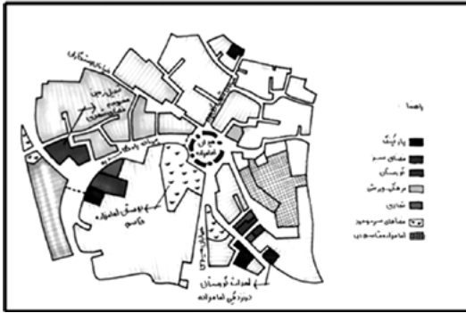
تصویر ۱۰- کاربری های پیشنهادی.