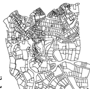
تصویر ۱- محدوده مورد مطالعه در مقیاس جهانی.

در این مقیاس فرایند شناخت و تحلیل از طریق تهیه اطلاعات و نقشه های پایه و تهیه جدول SWOT صورت گرفته است که بخشی از آن در ادامه می آید (جدول ۱) (تصویر ۳).