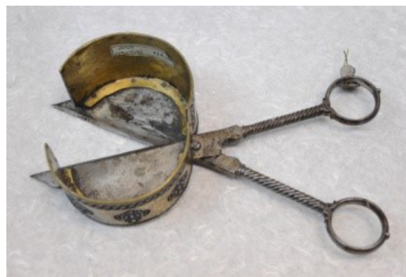
تصویر ۹- گل‌گیر (مقرض) فولادی صفوی با برج صفحه برنجی بر دیواره داخلی محفظه، طول ۲۹ سانتی‌متر.

«با تمام اهمیتی که شمع در قدیم داشته صنعت شمع‌سازی پیشرفته نبوده است زیرا نمی‌توانسته‌اند چربی لازم (از مواد مورد نیاز برای ساخت