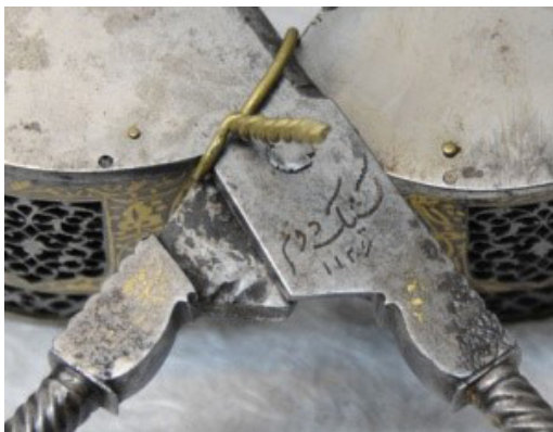
تصویر ۱۰- کتیبه کشیک دوم (دوم) بر روی گل‌گیر فولادی صفوی.

۵-چهل چراغ‌ها/لوسترها چهل چراغ و لوستر را می‌توان از انواع جارهای آویز محسوب کرد. جار، چراغ‌های چند شاخه به دو شکل زمینی یا پایه‌دار و آویز هستند که در انتهای هر شاخه محلی برای قرارگیری شمع تعبیه شده است (قدوسی، ۱۳۹۰، ۵۵). هرچند که اسامی چهل چراغ‌ها و لوسترها در اسناد صفوی آمده است اما به‌ندرت به مشخصات آنها اشاره شده است. در سند شماره ۳۲۱۶۸، به تاریخ ۱۰۶۹ قمری، از لوسترهایی با تزئینات «نقره خیاره‌دار» و «نقره کوب قبه‌دار» نام برده شده است. در برخی از موارد نیز به قطعات جانبی چهل چراغ‌ها مانند «سینی چهل چراغ» و در مواردی به مکان نصب آنها «چهل چراغ دارالسیاده» اشاره شده است.