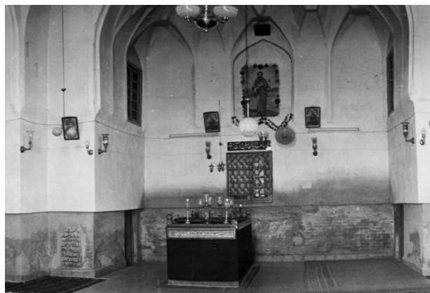
تصویر ۱- مقبره پیر پالان دوز، عکاس: صانع، دوره پهلوی. مأخذ: (مرکز اسناد آستان قدس رضوی)

در راستای سیاست‌های مذهبی صفویان و نهادینه کردن مذهب تشیع در ایران، مقابر امامان و امامزادگان به‌عنوان مکانی برای اشاعه فرهنگ شیعی در مرکز توجه قرار گرفت. از جمله این اماکن، آستان مقدس امام رضا (ع) به‌عنوان تنها آرامگاه امامان شیعه در ایران بود. از پیامدهای این امر افزایش چشمگیر موقوفات و تعداد زائران حرم مطهر، توسعه و گسترش حرم رضوی و به طبع آن شکل‌گیری و توسعه تشکیلات اداری آستان قدس رضوی بود. از جمله ملزوماتی که در این دوره بسیار به آن توجه شد، تأمین روشنایی حرم بود. تعدد وقف نامه‌ها و اسناد اداری و مالی با موضوع روشنایی، وجود بخش‌های اداری منظم و مشاغل مختلف که وظیفه تأمین و مدیریت روشنایی حرم را بر عهده داشتند، نشان‌دهنده اهمیت و ضرورت این امر است. مستندات مرتبط با روشنایی حرم رضوی