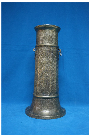
تصویر ۸- پیه‌سوز برنجی (پایه شمعدان) صفوی، قطر دهانه ۱۴ سانتی‌متر.

دهخدا در تعریف فانوس آورده است: «هر چراغی که جهت روشن کردن مسافت زیادی بر بالای بلندی مانند منار و جز آن، نصب کنند. آلتی که از مواد غیر حاجب نور سازند. خواه آن ماده شیشه و بلور باشد یا کاغذ یا پارچه و در آن چراغ گذارند تا از باد محفوظ بماند» (دهخدا به نقل از ناظم‌الاطباء، ۱۳۷۳، ۱۴۹۵۲). فانوس‌ها از جمله وسایل روشنایی هستند که اسامی آنها را می‌توان در اسناد روشنایی آستان قدس رضوی در دوره صفوی مشاهده کرد. اما جز در مواردی انگشت‌شمار هیچ نوع اشاره‌ای به ویژگی‌های آنها از جمله جنس، شکل و فرم و تزئینات در اسناد نشده است. تنها در سندی به‌شماره ۳۴۸۷۴ (۱۴-۱۱۱۳ قمری) از «فانوس دو لوله سرپوش‌دار» نام برده شده که به نظر می‌رسد محل قرارگیری شمع یا فتیله آن دوقسمتی بوده است. در اسناد دیگری نیز به‌شماره ۳۲۶۰۶ سنه ۱۱۰۳ قمری و ۳۲۷۷۶ سنه ۹۶-۱۰۹۵ قمری از «فانوس پس پشت مبارک» نام برده شده که نشان‌دهنده مکان نصب فانوس در حرم رضوی است.