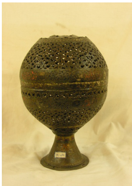
تصویر ۷- قندیل مفرغی مشبک دوره صفوی.