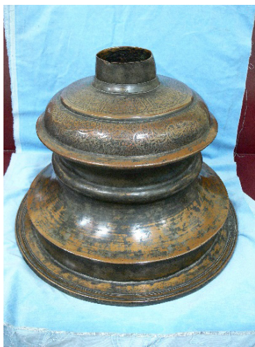
تصویر ۲- پایه شمعدان مسی، سنه ۸۶۳ ه.ق، ارتفاع ۳۹ سانتی‌متر. مأخذ: (موزه آستان قدس رضوی)

همچنین اسکندربیک ترکمان در خصوص حمله عبدالؤمن خان ازبک به مشهد در سال ۹۹۸ هجری، مصادف با سومین سال جلوس شاه‌عباس اول می‌نویسد: «روضه مقدسه بباد غارت و تاراج رفت قنادیل مرصع و طلا و نقره و شمعدان که از حیز تعداد بیرون بود ... به دست ازبکان بی تمیز نادان درآمده آن گرانمایه را چون خرف ریزه بی‌بها به یکدیگر می‌فروختند» (همان، ۴۱۳). مجموعه این روایات نشان می‌دهد