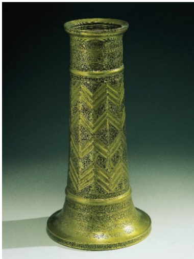
تصویر ۵- پایه شمعدان برنجی با شیارهای متقاطع در بدنه، ارتفاع ۴۳ سانتی‌متر، واقف: محمد بن علی الحسینی کاشانی. مأخذ: (موزه آستان قدس رضوی)