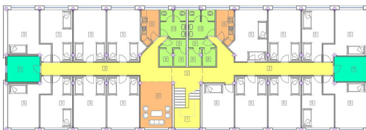
تصویر ۴- پلان معماری خوابگاه دانشجویی دختران بدون انجام تعمیرات و تغییرات کالبدی، (بلوک ۳ و ۴) دانشگاه شهید بهشتی.