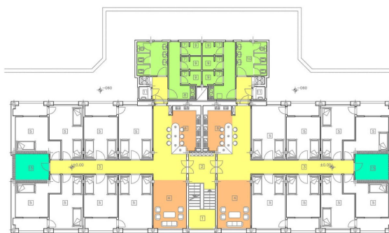
تصویر ۳- پلان معماری خوابگاه دانشجویی دختران پس از انجام تعمیرات و تغییرات کالبدی، (بلوک ۱ و ۲) دانشگاه شهید بهشتی.