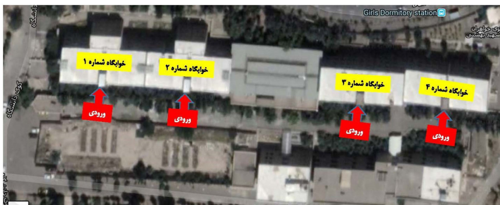
تصویر ۲- عکس هوایی از چهار بلوک خوابگاه دانشجویی دختران دانشگاه شهید بهشتی.

در طول دوره تعطیلی تابستان سال ۱۳۹۵، در دو بلوک ۱ و ۲، تعمیرات اساسی و تغییراتی در معماری فضاها انجام شد (تصویر ۳) و در دو بلوک ۳ و ۴ تغییر معماری صورت نگرفت (تصویر