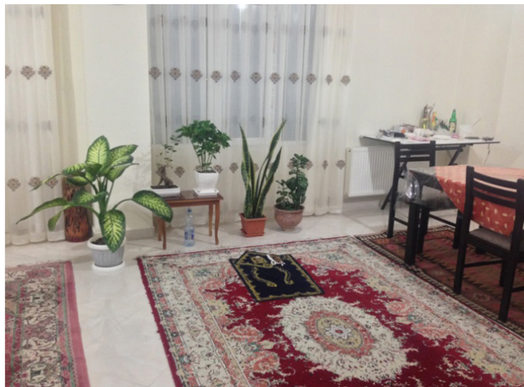
تصاویر ۲ و ۳- محل نماز خواندن پدر در پذیرایی. نمونه A_2 (سمت راست) و نمونه A_1 (سمت چپ).