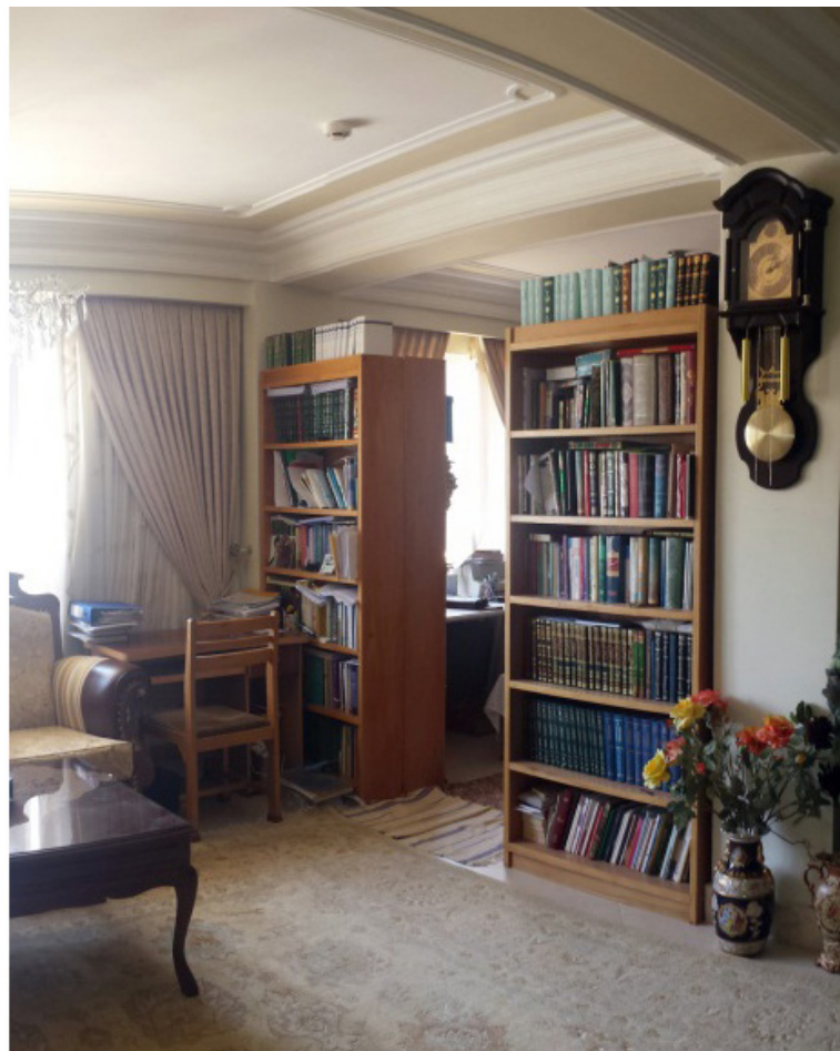
تصاویر ۴ و ۵ - در نمونه A 1 در مورد فضای نگهداری اسناد و وسایل (دو تصویر فوق) آمده است: «البته شایان ذکر است که محل اصلی کار و فعالیت پدر در همان اتاق پذیرایی است. تصویر سمت راست، منتها در گوشه‌ای که مزاحمتی برای سایر اعضا نداشته باشد و همچنین با جداره‌هایی از قفسه‌های کتاب قابل تعریف است که البته با توجه به تداخل نسبی حریم این فضا، که قابل انکار نیز نیست - به نظر می‌رسد مکان مناسبی نیست».