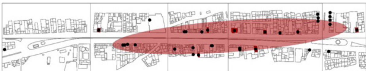
تصویر ۸- نقشه توزیع فعالیت های واسطه گری (کد ۶) خیابان امام خمینی شهر هشتگرد.