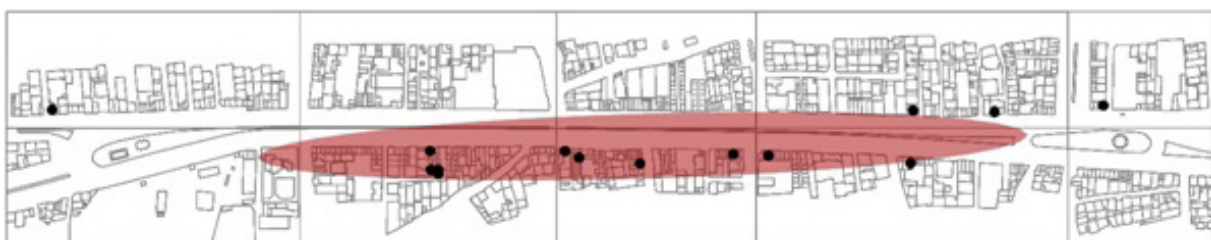
تصویر ۴- نقشه توزیع فعالیت‌های عمده‌فروشی (کد ۲) خیابان امام خمینی شهر هشتگرد.