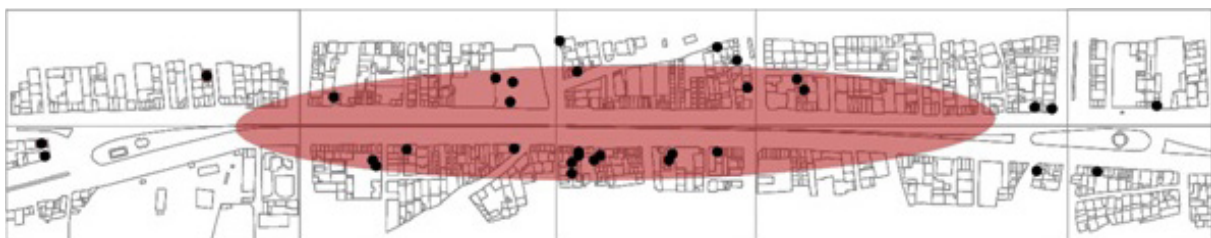
تصویر ۳- نقشه توزیع فعالیت‌های تولیدی (کد ۱) خیابان امام خمینی شهر هشتگرد.