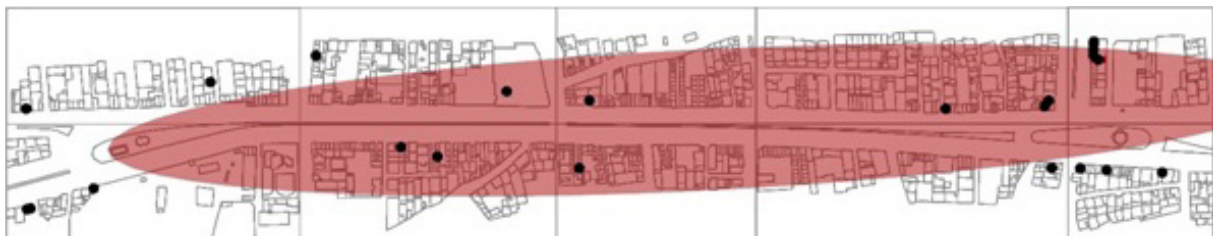
تصویر ۷- نقشه توزیع فعالیت های تعمیرات فنی (کد ۵) خیابان امام خمینی شهر هشتگرد.