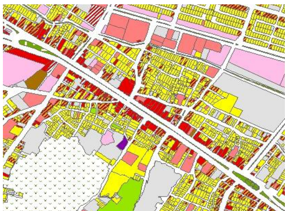
تصویر ۲- خیابان امام خمینی در شهر هشتگرد

دوم، تغییر خصلت خیابان به جهت رواج مدرنیزاسیون زندگی مردم: گرایش غالب فعالیت اقتصادی در زمینه رشد مراکز خدمات شخصی با نرخ رشد سالانه ۷ درصد، بهداشت و درمان با رشد سالیانه ۵ درصد، خدمات آرایشی و بهداشتی با رشد ۱۵ درصد در سال، خدمات مشاوره و خدمات آموزشی غیررسمی با نرخ ۱۴ درصد در سال، خدمات اداری با نرخ رشد ۸ درصد در سال، خرده فروشی لوازم برقی با نرخ رشد ۲۴ درصد در سال، خرده فروشی لوازم خانگی (صوتی و موبایل) با نرخ رشد ۲۶ درصد در سال، فروش لوازم و کالاهای فرهنگی با نرخ ۱۴ درصد در سال، لوازم ورزشی و بازی، کادو و گل و کیف و کفش با نرخ ۱۰ درصد در سال، پوشاک با نرخ رشد ۱۸ درصد در سال، و مراکز فروش لباس با نرخ ۱۶ درصد در سال، حکایت از تغییر خصلت اقتصادی و اجتماعی عملکردهای خیابان به جهت کاراکتر مدرن آن دارد. به عبارت دیگر اگر این خیابان در سال ۱۳۷۳