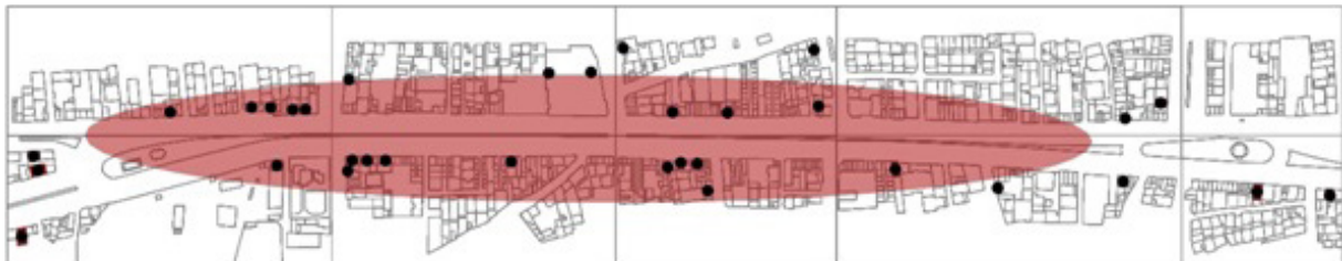
تصویر ۶- نقشه توزیع فعالیت های پذیرایی (کد ۴) خیابان امام خمینی شهر هشتگرد.