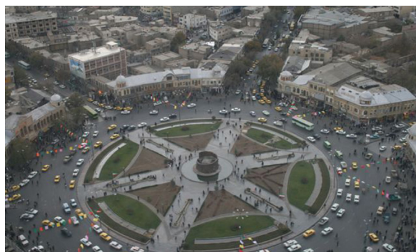
تصویر ۱- نمای کلی از میدان امام.