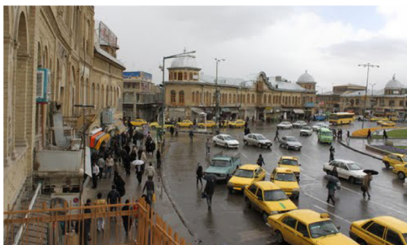
تصویر ۲- نمای قسمتی از میدان امام.