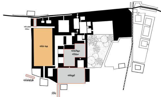
تصویر ۴- ساختار فضایی جبه خانه در مجموعه قصر حکومتی دارالسلطنه بر اساس مستندات تاریخی.