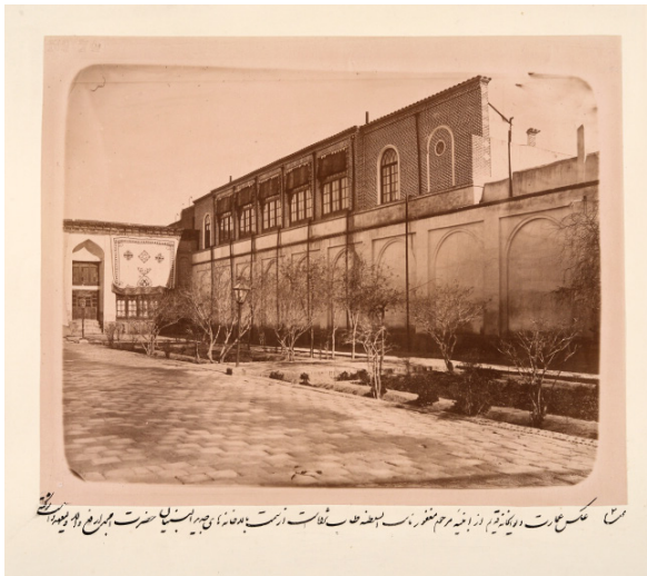
تصویر ۵- تصویر دیوانخانه (آرشیو اسنادی کاخ گلستان).

این واژه در لغت به معنای (دیوان + خانه) بارگاه سلطنت. عدالتخانه. (ناظم الاطباء). محکمه. دارالقضاء. دارالحکومه. (ناظم الاطباء). اداره حاکمی. محل نشستن امراء و ارباب دفاتر. (آندراج). مقابل اندرون خانه. بیرونی. در متون آمده است: «امروز چهارشنبه بیست و هفتم باید به صرف نهار به عمارت ولیعهد که در شهر است برویم. رفتیم به دیوانخانه ولیعهد که تازه صاحب دیوان ساخته و بسیار خوب عمارت است. از آنجا به دیوانخانه قدیم نایب السلطنه رفتیم. پس از آن به عمارت و باغ اندرونی ولیعهد رفته، قدری گردش کرده و آمدیم بیرون در تالار نشستیم. بعد رفتیم نزدیک عمارتی که سرایخانه قدیم بود» (قاجار، ۳۰، ۱۳۶۳). تصویری نیز این بنا موجود است که در زیرنویس آن آمده است: «عکس عمارت دیوانخانه قدیم از ابنیه مرحوم مغفور نایب السلطنه طاب ثرا است از سمت بالاخانه های جدید البنیان حضرت امجد ارفع والد ولیعهد دا شوکتی»