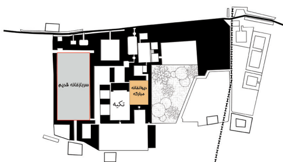
تصویر ۶- ساختار فضایی دیوانخانه مجموعه قصر حکومتی دارالسلطنه بر اساس مستندات تاریخی.