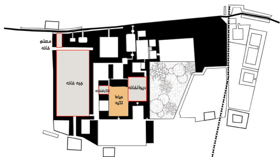
تصویر ۸- ساختار فضایی حیاط تکیه در مجموعه قصر حکومتی دارالسلطنه براساس مستندات تاریخی.

این واژه در لغت به معنای ۱- محل حفاظت توپ‌ها. ۲- واحدی در نظام که وظیفه آن تیراندازی با توپ است. یرمولف، گزارش جامع و روشنی به دربار روسیه فرستاده و در آن صریحاً نوشته بود که: عباس میرزا پسر دوم شاه که اعلان کرده‌اند ولیعهد است به یاری انگلستان اصلاحات مهمی را شروع کرده است و لشکریان عظیمی براساس بسیار منظمی تشکیل می‌دهد. توپخانه وضع کاملی دارد و روزافزون است (نجمی، ۱۳۷۷، ۹۰). توپخانه موسعی هم در جنب دیوانخانه ساخته‌اند