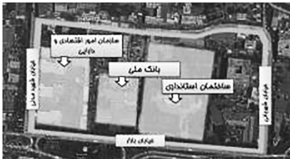
تصویر ۲- موقعیت کنونی ساختمان‌های واقع در سایت مجموعه قصر حکومتی در سال ۱۳۹۲ ه. ش.

مجموعه قصرهای حکومتی دارالسلطنه ۲ تبریز یکی از باارزش‌ترین ساخت و سازهایی است که در دوره قاجار ساخته شده بود که با توجه به اندک اسناد تصویری باقی مانده در نوع خود منحصر به فرد بوده است. این مجموعه در مرکز شهر و ضلع شرقی بازار تبریز در محدوده نسبتاً وسیعی با مساحتی برابر ۷،۵ هکتار واقع شده بود.