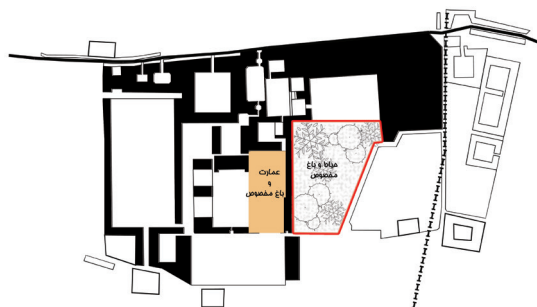
تصویر ۱۱- ساختار فضایی عمارت و باغ مخصوص در مجموعه قصر حکومتی دارالسلطنه بر اساس مستندات تاریخی.