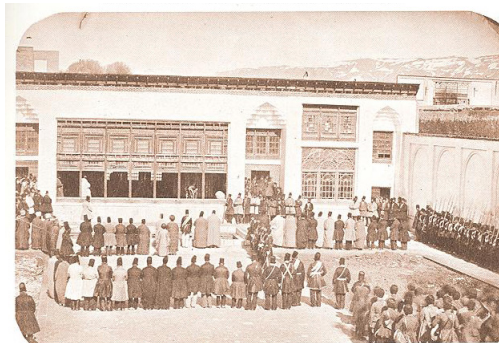
۱۰- مراسم سلام مظفردالدین میرزا ولیعهد در تبریز، محل برگزاری سلام عمارت حرمخانه در کاخ عالی قاپوی آن شهر است. دهه ۱۳۰۰ هـ. ق. ۱۳۰۰-۱۳۱۲ م.

تصویری از این فضا موجود است که در زیرنویس آن آمده است: «مراسم سلام مظفردالدین میرزا ولیعهد در تبریز، محل برگزاری سلام دارالسلطنه تبریز در تبریز، محل برگزاری سلام عمارت حرمخانه در کاخ عالی قاپوی آن شهر است. دهه ۱۳۰۰ هـ. ق.»