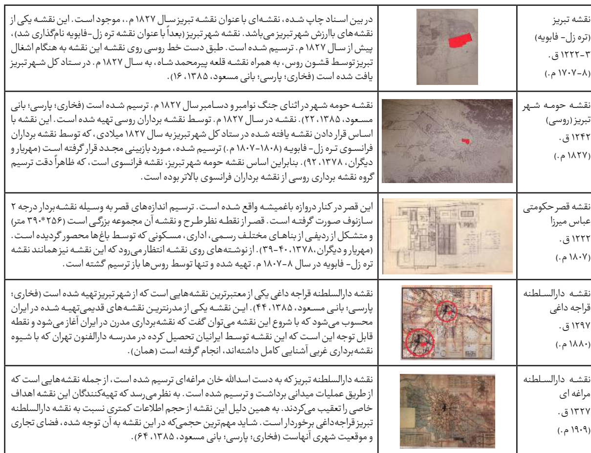
جدول ۱- نقشه‌های تبریز دوره قاجار.

همانطور که در بررسی وضعیت کنونی مجموعه مشخص گردید، در حال حاضر هیچ اثری از عمارت‌های مجموعه قصر حکومتی باقی نمانده و بناهای جدید در این محل احداث گردیده است. بنابراین ضروری است که در ابتدا از نقشه‌های تهیه شده از شهر تبریز در دوره قاجار استفاده گردد تا موقعیت مجموعه قصر حکومتی و مکانیابی عمارت‌ها بازخوانی گردد. تبریز از معدود شهرهای ایران است که تاکنون ۱۰ نقشه، به صورت کروکی و یا ترسیم به شیوه مدرن از آن در دست است (تهرانی و دیگران، ۱۳۸۵، ۱۰). مجموعه قصرهای حکومتی دارالسلطنه در ۵ نقشه که در دوره قاجار ترسیم گردیده، مشخص می‌باشد (جدول ۱).