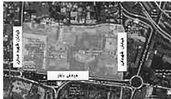
تصویر ۱- موقعیت کنونی سایت مجموعه قصر حکومتی در سال ۱۳۹۲ ه. ش.