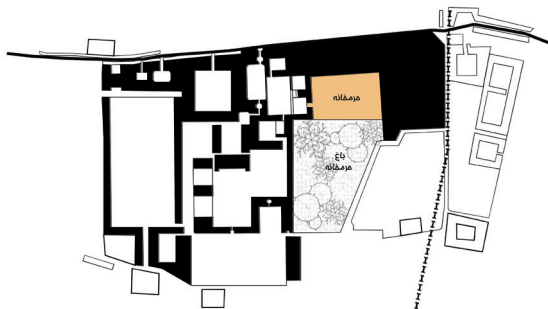
تصویر ۱۰- ساختار فضایی حرمخانه در مجموعه قصر حکومتی دارالسلطنه بر اساس مستندات تاریخی