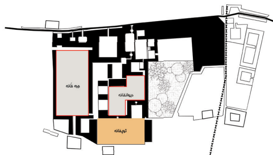
تصویر ۷- ساختار فضایی توپخانه در مجموعه قصر حکومتی دارالسلطنه براساس مستندات تاریخی.

جدول ۴- تصاویر توپخانه.