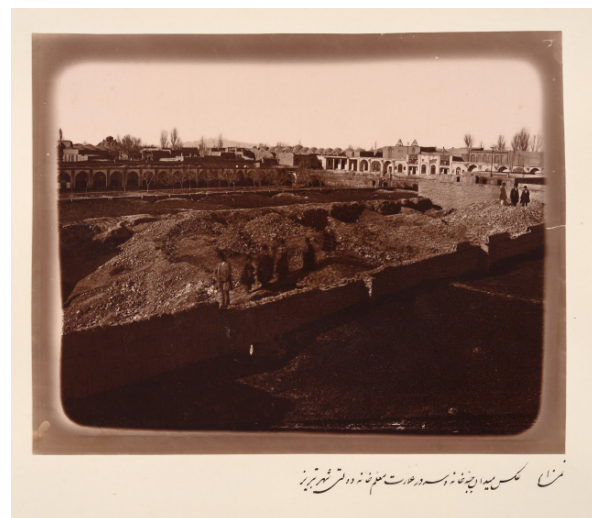
تصویر ۳- تصویر میدان جبه خانه.