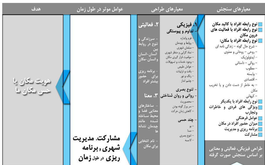
تصویر ۲- مدل طراحی براساس هویت مکان و حس مکان.

۱- سنجش وضعیت موجود براساس معناهای ساخته شده در ذهن انسان با توجه به حس مکان انسان به طور مثال در این مرحله به بررسی نوع رابطه انسان با کالبد مکان پرداخته می شود. هدف از این بررسی، دریافت نظرات و دیدگاه های استفاده کنندگان در ارتباط با عناصر مختلف کالبدی مکان می باشد. نتایج حاصل از این دیدگاه ها و نظرات، بیان گر کالبد های مشترک، بارزو مشخص از دید استفاده کنندگان و سپس بهره گیری از عناصر و اجزای موجود و طراحی براساس آن عناصر می باشد.