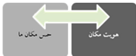
تصویر ۵- مدل هویت مکان و حس مکان.

در نهایت این گونه می‌توان بیان نمود که هویت مکان