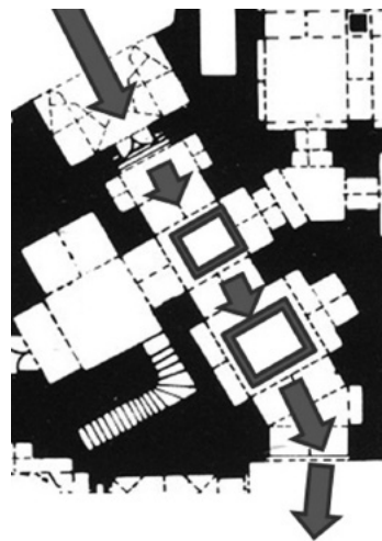
تصویر ۲- دیاگرام نظام ورودی-مسجد آقا نور اصفهان.

کنج یا زوایایی غیر از وسط جداره صحن محقق می‌شود؛ در بیشتر موارد با پیچیدگی‌هایی در مسیر دسترسی مواجه هستیم. چرخش و ایجاد پیچش در مسیر، افزایش طول مسیر، افزایش ریتم و تنگی و گشادگی فضا، ابزارهایی هستند که معمار به مدد آنها بر پیچیدگی در نظام ورودی افزوده است.