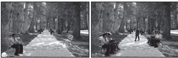
تصویر ۱- نمونه ای از تصاویر استفاده شده در پرسشنامه مرحله دوم در رابطه با شاخص تعداد افراد در واحد سطح.

در ارتباط با سرویس بهداشتی و آبخوری فاصله استقرار افراد با آنها و همچنین برای جمعیت افراد در پارک به صورت تصویری (تصویر ۱) تعداد در واحد سطح بررسی شد. پرسشنامه های مرحله دوم به تعداد ۲۳۵ پرسشنامه در پنج پارک توزیع شد. انتخاب این پنج پارک براساس نتایج حاصل از تجزیه و تحلیل آزمون کروسکال والیس صورت گرفت. این آزمون علاوه بر تعیین پارکها در مرحله دوم پرسشنامه ها، به منظور تعیین اختلاف نظر افراد در ۱۰ پارک مطالعه شده نیز استفاده شد. نظر افراد در ارتباط با شاخص هایی که در زمینه مدیریت و مسائل اجتماعی تعیین شد در میان پارک های مورد مطالعه دارای اختلاف معنی دار در سطح ۱% بود. با توجه به اینکه امکانات موجود در پارک های مورد مطالعه متفاوت است و در سطح یکسانی نمی باشد و همچنین تعداد بازدیدکنندگان پارکها نیز به دلیل مساحت متفاوت آنها با یکدیگر اختلاف دارد، بنابراین می توان نتیجه گرفت که شاخص های تعیین شده آنها می باشند که بر رضایت بازدیدکنندگان تاثیر گذاشته و باید میزان استاندارد برای آنها تعیین کرد.