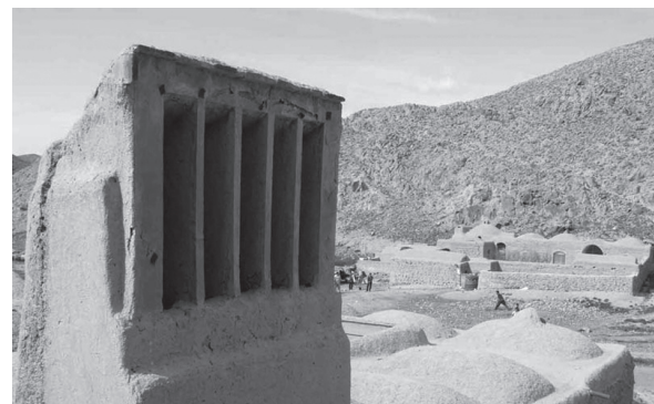
تصویر ۴- بادگیری در اردکان.