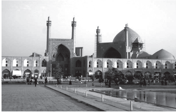
تصویر ۱- مسجد امام اصفهان.

امام اصفهان مهربان و شاد (تصویر ۱) و کلیسای نتردام پاریس ترساننده و سنگین می‌باشد (تصویر ۲). «معماری ما شاعرانه، پیچیده و تو در تو می‌باشد» (بهشتی، ۱۳۸۷، ۱۰). ویژگی‌های کیفی که در مکان معماری ایرانی به منصفه ظهور رسیده است.