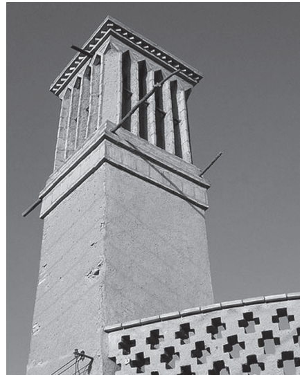
تصویر ۳- بادگیری در یزد.

دارند و بسیاری نکات مشترک بین این دو نقطه وجود دارد؛ در حالی که وزش باد در این دو شهر کاملاً متفاوت است؛ که همین تفاوت عرف ساخت و جهت‌گیری بادگیرهای این دو شهر را تحت تاثیر قرار داده است. همین تفاوت کوچک، جهت و جای یک عنصر معماری مشابه را در این دو شهر عوض کرده است، به گونه‌ای که بادگیرهای یزد چهار طرفه است و بادگیرهای اردکان یک طرفه می‌باشد (بهشتی، ۱۳۸۶) (تصاویر ۳ و ۴). خوشبختانه بنا به طولانی بودن و تداوم و تعامل انسان با معماها و عرف‌های زیستی در بستر طبیعی ایران، رازها و مشترکات اقلیمی بخش‌های مختلف این سرزمین در طول تاریخ چند هزار ساله شناخته شده و با خلاقیت و ابتکار معماران بخشی از آنها رمزگشایی شده است.