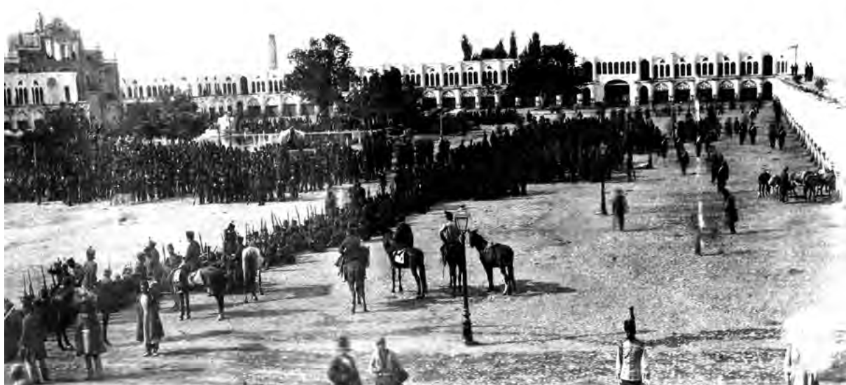
تصویر ۳- مراسم جشن شربت خوران به مناسبت تولد ناصرالدین شاه در میدان توپخانه

هنوز هم مراسم عید قربان در آن برگزار می شود. توضیح این مراسم را به تفصیل در سفرنامه های سیاحان فرنگی که به ایران آمده اند و یا خارجیان مقیم ایران و به صورت مختصر در نوشته ها و خاطرات ایرانیانی مثل مخبرالسلطنه (۱۳۷۵) و معیرالممالک (۱۳۶۲، ۶۱-۶۲) می توان یافت. این مراسم را اورسل چنین نقل می کند: