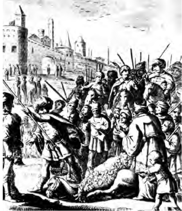
تصویر ۱- مراسم عید قربان در دوران صفوی.

علاوه بر اینکه میدان نقش جهان و خیابان چهارباغ محلی برای برگزاری مراسم، جشن ها و نمایش های عمومی بوده اند، اصولاً برای این منظور طراحی شده اند. عمارت های بالای سر در ورودی در خیابان چهارباغ و ایوان های طبقه دوم در اطراف میدان نقش جهان برای این پیش بینی شده اند که بتوان در آنها نشست و مراسم و نمایش را در خیابان و میدان دید (اهری، ۱۳۸۵، ۵۲) (ر.ک. به تصویر ۲). خیابان چهارباغ و میدان نقش جهان با طراحی اندیشیده و کالبدی مناسب در به نمایش گذاشتن دستاوردهای شهر و ایجاد زمینه ای برای آیین های عمومی؛ خصوصیتی که به گفته کوستوف از ویژگی های فضای عمومی است (Kostof, 1992, 194) ۹ ، کاملاً موفق است. در واقع