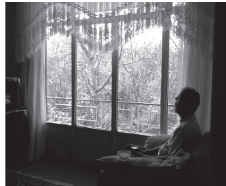
تصاویر ۱ و ۲-۳- اهمیت چشم‌اندازهای طبیعی، ادراک مستقیم رویدادهای طبیعی در فضای فعالیت.