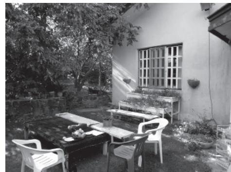
تصاویر ۴، ۵ و ۶- شکل‌گیری کانون‌های فعالیت در فضاهایی که امکان ادراک عناصر طبیعی وجود دارد.