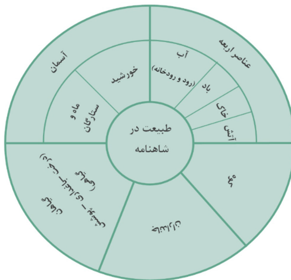
نمودار ۳. عناصر طبیعت در شاهنامه.